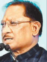
एनटीपीसी लारा के सीएसआर मद से बन रहा

छह मंजिला छनके वाला जगदेव राम उराव कल्याण आश्रम धर्मार्थ चिकित्सालय 100 बिस्तरों की क्षमता वाला होगा। यहां 15 ओपीडी, आईसीयू, 4 आधुनिक ऑपरेशन थियटर, फिजियोथेरेपी सेंटर, पैथोलॉजी लैब, सीटी स्कैन, एक्सआरआई, डायलिसिस युनिट, एक्सरे, ईसीजी और इमरजेंसी वार्ड जैसी अत्याधुनिक सुविधाएं उपलब्ध होंगी। नरोंज की सुविधा के लिए लिफ्ट और रैफ का भी निर्माण किया जाएगा।