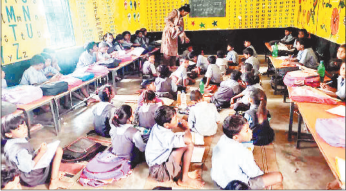
प्राथमरी के सभी बच्चों को एक साथ पढ़ाती शिक्षिका।