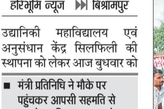
हरिभूमि न्यूज विश्रामपुर

उद्यानिकी महाविद्यालय एवं अनुसंधान केंद्र सिलफिली की स्थापना को लेकर आज बुधवार को मंत्री प्रतिनिधि ने मौके पर पहुंचकर आपसी सहमति से मामले का निराकरण करने का दिया सुझाव, प्रभावित ग्रामीणों ने जताई नाराजगी। प्रस्तावित सीमांकन कार्य पर माननीय उच्च न्यायालय के आदेश प्राप्त होने के बाद रोक लगा दी गई साथ ही मंत्री प्रतिनिधि ठाकुर राजवाड़े की उपस्थिति में मदनपुर में प्रभावित लोगों के साथ बैठक कर आपसी तालमेल मिलाकर निराकरण करने का प्रयास किया गया। गौरतलब है कि राज्य शासन ने 4 जुलाई 2025 को जारी आदेश में