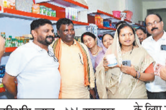
हरिभूमि न्यूज सूरजपुर