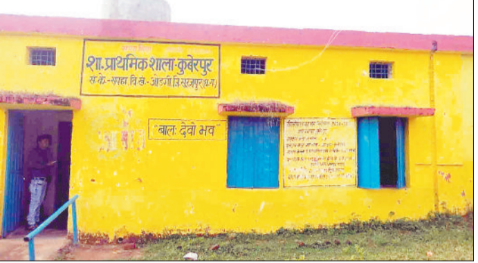
जर्जर स्कूल भवन।